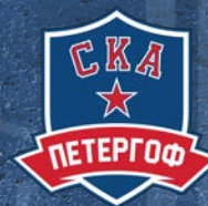
СКА-Петергоф 250 детей