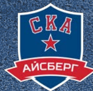
СКА-Айсберг Г. Великий Новгород (Новгородская обл.) 150 детей