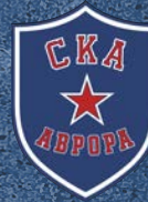
СКА-Аврора Команда девушек