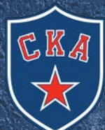
СДЮШОР СКА 300 детей