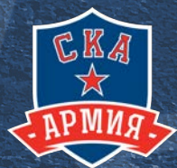
Армия СКА 200 детей

12 школ в 6 субъектах России | 3000 воспитанников от 5 до 17 лет