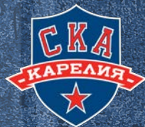
СКА-Карелия Г. Кондопога (Республика Карелия) 200 детей