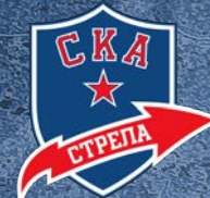
СКА-Стрела Команда по следж-хоккею