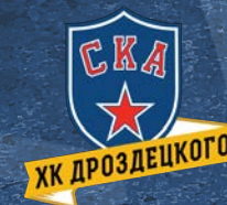
СКА-ХКД 300 детей