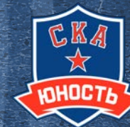
СКА-Юность Г. Екатеринбург (Свердловская обл.) 300 детей