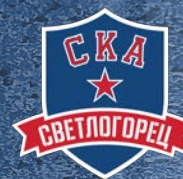
СКА-Светлогорец Г. Светлогорск (Калининградская обл.) 150 детей