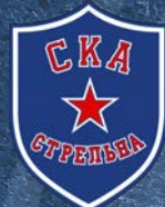
СКА-Стрельна 450 детей