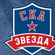
СКА-Звезда 300 детей